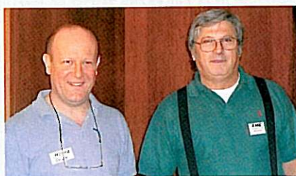
IK2MMB(左), IK3COJは、いずれもイタリアのアクティブなEME'er